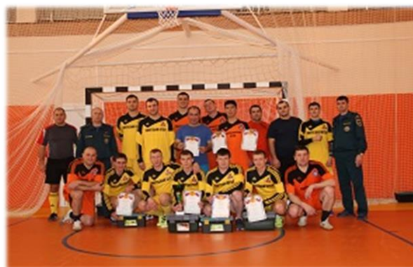
Соревнования между командами Айхальского и Удачинского ВГСВ