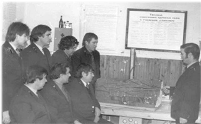
Теоретические занятия по горноспасательному делу.

Горноспасательная служба филиала «Якутский ВГСО» богата своими традициями, историей и талантливыми людьми. Зачастую, придя служить или работать в горноспасательную службу, они остаются в профессии на годы. Потом приходят их дети, с малых лет вдохновлённые примером родителей. В подразделениях филиала «Якутский ВГСО» ФГУП «ВГСЧ» трудились и продолжают трудиться представители семейных династий. Их отличает высокий профессионализм, мужество, отвага и особая преданность своему делу.