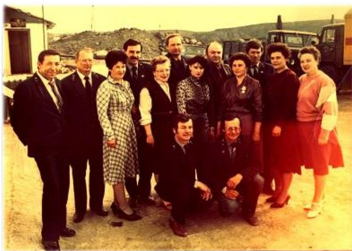
Как молоды мы были....