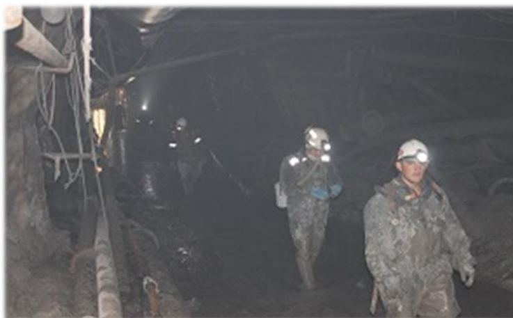
Ликвидация последствий аварии при затоплении на руднике «Мир» АК «АЛРОСА» (ПАО) 2017 год