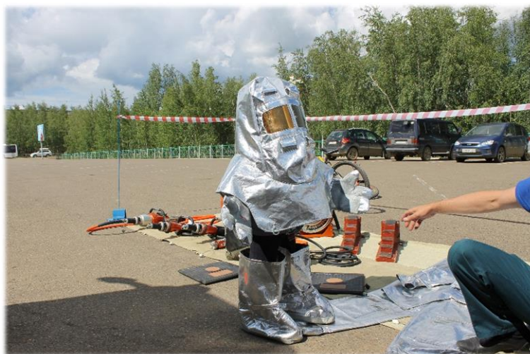
День открытых дверей.