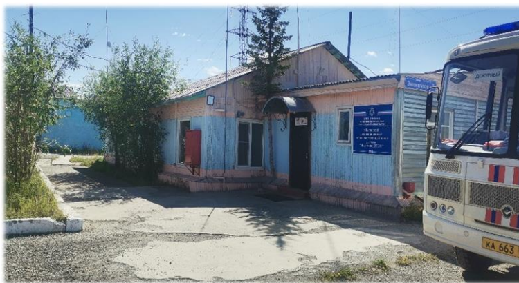
Здание Административно-бытовой комплекса Айхальского ВГСВ Филиала «Якутский ВГСО»