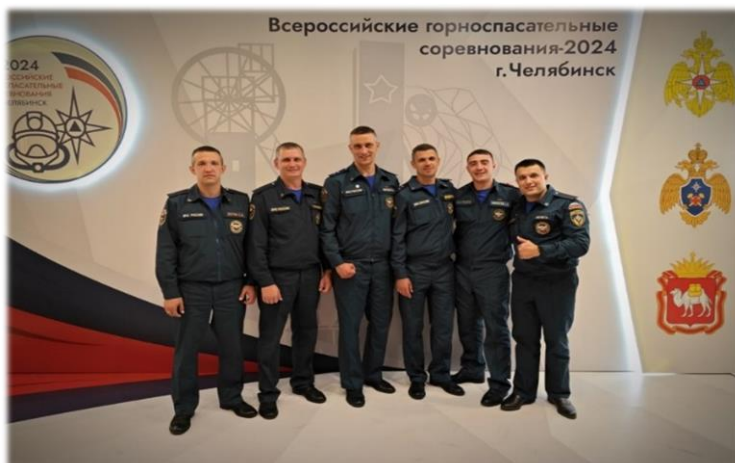
Команда филиала «Якутский ВГСО» На соревнованиях по тактической-технической подготовке на звание «Лучшее отделение» среди подразделений ФГУП «ВГСЧ» Российской Федерации. 2024 год

Участники команды получили огромный опыт соревновательной тактики, который будет применен при ведении горноспасательных работ. По итогам Всероссийских соревнований по тактической подготовке работников аварийно-спасательных служб, аварийно-спасательных формирований, выполняющих горноспасательные работы – команда филиала «Якутский ВГСО» ФГУП «ВГСЧ» в общекомандном зачете заняла 8 место.