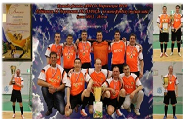
Команда Мирнинского ВГСВ

В целях формирования здорового образа жизни, повышения уровня физической подготовки работников филиала «Якутский ВГСО», развития чувства коллективизма, в филиале ведётся спортивно-оздоровительная деятельность. Личный состав отряда, регулярно, активно участвуют в различных спортивных мероприятиях, организуемых органами местного самоуправления по месту дислокации подразделений, неоднократно занимали призовые места.