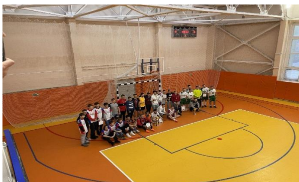
Соревнования между коллективами Удачинского ГОК АК «АЛРОСА» (ПАО) Совместное фото команд участниц.