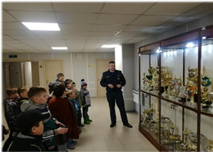
День открытых дверей.

Общественная деятельность филиала «Якутский ВГСО» направлена на пропаганду общественной значимости и престижа профессии горноспасатель. В подразделениях филиала «Якутский ВГСО» с целью популяризации профессии и службы ВГСЧ проводятся мероприятия «Дни открытых дверей» с приглашением в подразделения обучающихся средних школ. На мероприятиях осуществляется показ горноспасательного оснащения, проводится лекция, демонстрируется тактика ликвидации аварий. В дни государственных праздников коллективами подразделений возлагаются цветы к памятным мемориалам.