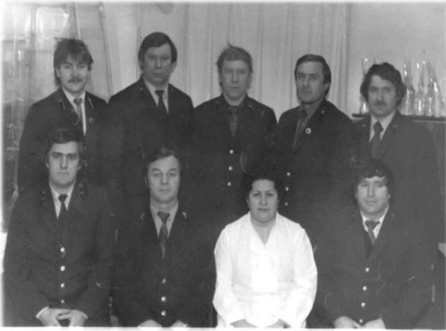
Коллектив Мирнинского ВГСВ