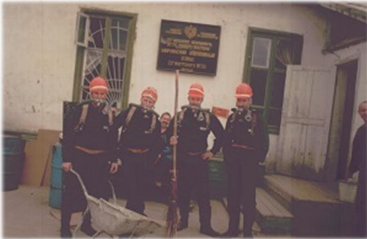
Немного позитива при проведении тренировки в респираторах