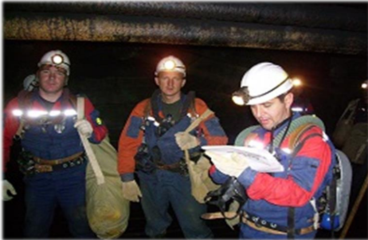
Ликвидация последствий взрыва метана-воздушной смеси на шахте «Ульяновская» ОАО «Южкузбассуголь» 2007 год.

В сентябре 2006 года три отделения Мирнинского ВГСВ, в количестве 19 человек, были направлены в Читинскую область на оказание помощи горнякам, пострадавшим при пожаре на шахте «Центральная» рудника «Вершино-Дарасунский». Личным составом были выполнены работы по разведке, поиску и эвакуации пострадавших горнорабочих на поверхность. Был выполнен большой объём работ по возведению противопожарных перемычек для локализации очагов пожара. За проявленное мужество и умелые действия при ликвидации аварии губернатор Читинской области наградил горноспасателей Мирнинского ВГСВ ценными подарками.