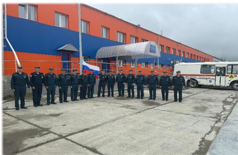
Новое здание Административно-бытовой комплекса Удачнинского ВГСВ Филиала «Якутский ВГСО» с 2017 года