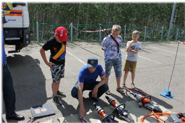
День открытых дверей.