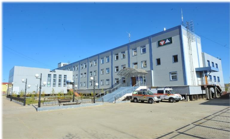
Административно-бытовой комплекс Филиала «Якутский ВГСО»

отряд» ФГУП «СПО «Металлургбезопасность» переименован в филиал «Якутский военизированный горноспасательный отряд» ФГУП «Военизированная горноспасательная часть» (ФГУП «ВГСЧ»).