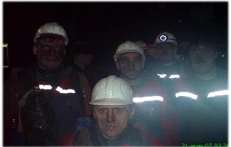
Ликвидация последствий взрыва метана-воздушной смеси на шахте «Ульяновская» ОАО «Южкузбассуголь» 2007 год.

19 марта 2007 года на шахте «Ульяновская» ОАО «Южкузбассуголь» произошел взрыв метановоздушной смеси, в результате которого погибли 110 человек, 8 человек получили травмы различной степени тяжести. Пять отделений филиала «Якутский ВГСО», в количестве 31 человека были направлены для участия в ликвидации аварии на шахте «Ульяновская». Личным составом были выполнены