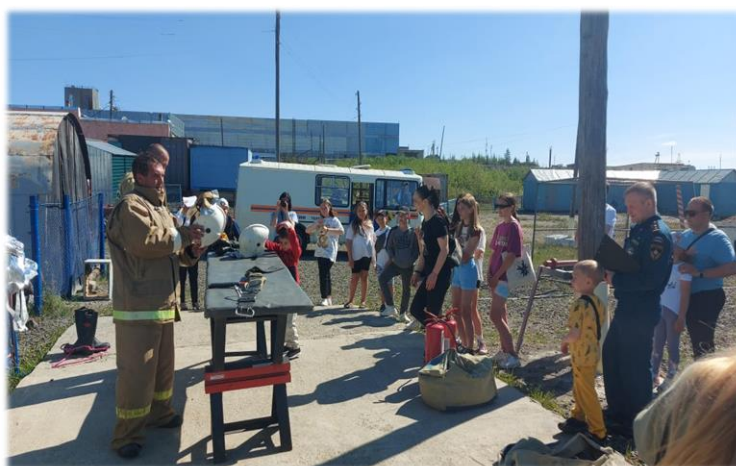
День открытых дверей.