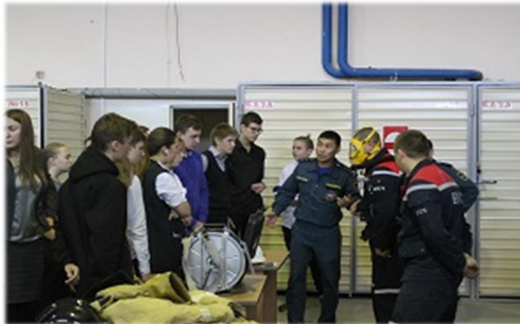
День открытых дверей.