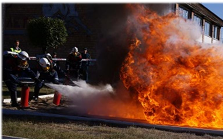
Команда филиала «Якутский ВГСО» На соревнованиях по тактической-технической подготовке на звание «Лучшее отделение» среди подразделений ФГУП «ВГСЧ» Российской Федерации. 2013 год

С 11 по 16 августа 2024 года в Челябинской области в г. Копейск проведены соревнования по тактико-технической подготовке работников аварийно-спасательных служб (формирований), выполняющих горноспасательные работы. В соревнованиях приняло участие 22 команды от трех организаций ВГСЧ МЧС России: ФГУП «ВГСЧ», ФАУ «ВГСЧ в строительстве» и ФГКУ «Национальный горноспасательный центр».