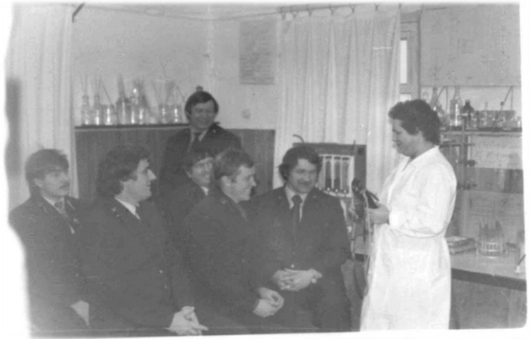
Теоретические занятия с работниками КИЛ