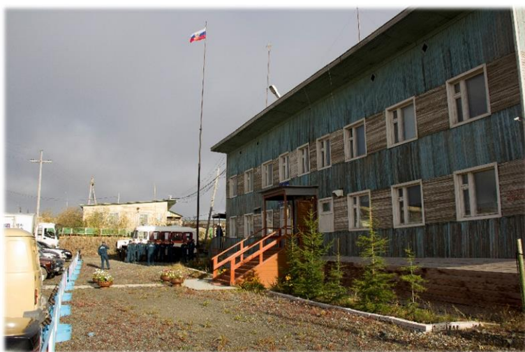
Старое здание Административно-бытовой комплекса Удачнинского ВГСВ Филиала «Якутский ВГСО» до 2017 года