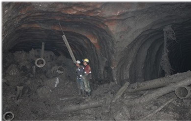
Ликвидация последствий аварии при затоплении на руднике «Мир» АК «АЛРОСА» (ПАО) 2017 год

За проявленную при выполнении горноспасательных работ смелость, стойкость и выдержку горноспасатели филиала «Якутский ВГСО» ФГУП «ВГСЧ» были награждены медалями «За отличие в ликвидации чрезвычайной ситуации» и ценными подарками.