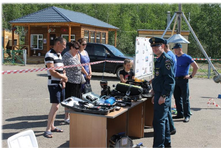
День открытых дверей.