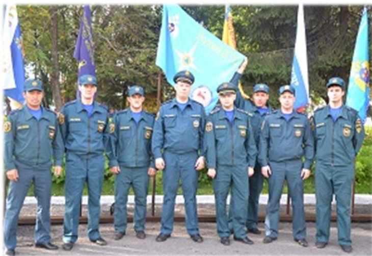
Команда филиала «Якутский ВГСО» На соревнованиях по тактической-технической подготовке на звание «Лучшее отделение» среди подразделений ФГУП «ВГСЧ» Российской Федерации. 2013 год

На соревнованиях по тактической-технической подготовке на звание «Лучшее отделение» среди подразделений ФГУП «ВГСЧ» Российской Федерации в 2013 году среди 16-ти команд, команда филиала «Якутский ВГСО» ФГУП «ВГСЧ» заняла первое место в номинации «Лучший командир взвода», третье место в номинации «Спортивно-прикладная эстафета», присвоен диплом «Самое зрелищное выступление», присвоено пятое место в общекомандном зачете.